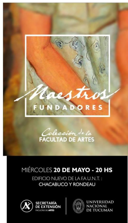
Flyer de la Muestra "Maestros Fundadores" 1

La Facultad de Artes de la UNT fue atesorando a través de los años un valioso conjunto de bienes culturales que permiten, de alguna manera, relatar la historia de la institución, generando una conciencia de memoria e identidad.