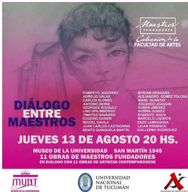
Flyer Muestra "Diálogo entre Maestros"