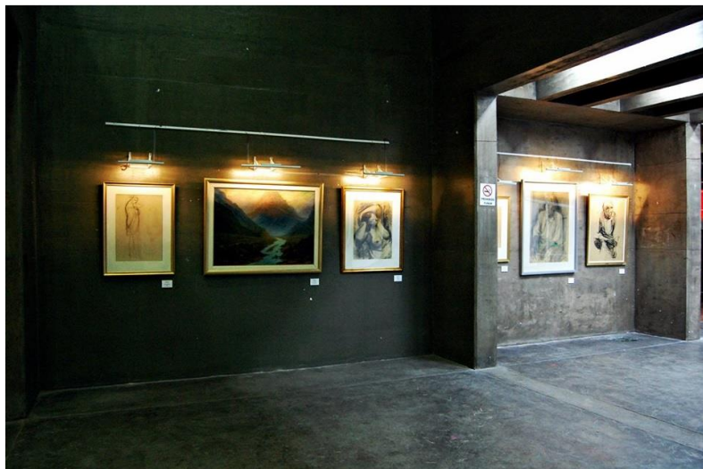
Espacio destinado a funcionar como sala de exposición. Montaje y resultado final.

Esta primera etapa resultó exitosa ya que se pudieron cumplir los objetivos propuestos y se generó un importante impacto en la comunidad universitaria, suscitando al debate y la crítica desde los distintos sectores que la conforman. Se formularon diferentes líneas de discusión que se proyectaron más allá de la misma Facultad, siendo este aspecto altamente positivo ya que se generó una re visualización del patrimonio, pudiendo así aportar a la revalorización y participación activa de estas obras y artistas en el discurso universitario.